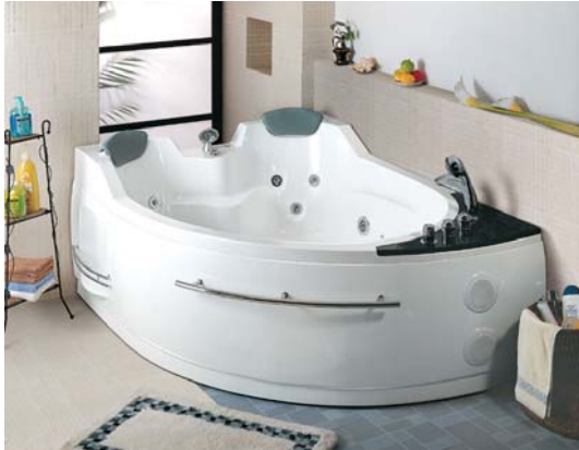
Abbildung zeigt die rechte Version